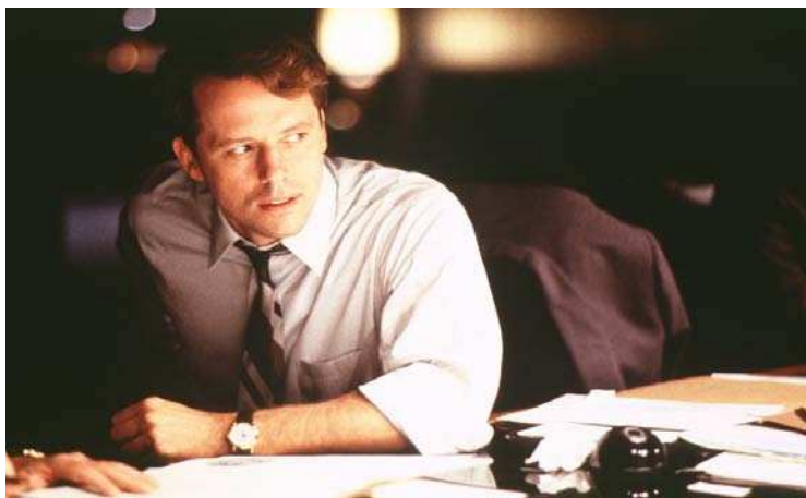
Thirteen days . Steven Culp nel ruolo di Robert Kennedy.

Oltre che fondamentale nel negoziare la pace con l'ambasciatore sovietico, ebbe il merito di convincere molti collaboratori del presidente ad evitare un attacco a sorpresa su Cuba, paragonando questa eventualità ad una «Pearl Harbour causata dagli Stati Uniti» 31 .