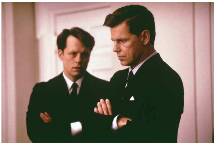
Thirteen Days . “Bobby non era il numero Due, era il numero Uno e mezzo”. Steven Culp nel ruolo di Bob Kennedy e Bruce Greenwood in quello di JFK.