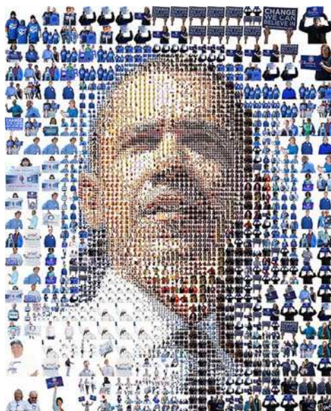
Barack Obama: un mosaico di persone

Può essere considerato un emblema di questo intreccio il lavoro di tsevis, un utente di Flickr che ha realizzato un ritratto di Obama a partire da una serie di fotografie pubblicate su change.gov: