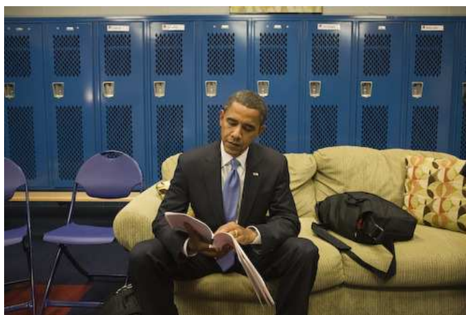
Obama si prepara al dibattito televisivo di Nashville 32

L'utente modello che emerge dal profilo è quello di una persona che segue, letteralmente, Obama nei suoi spostamenti, ed è in grado di riprendere la sua partecipazione agli eventi attraverso fotografie, di pubblicarle sul profilo o commentarle in modo da lasciare una traccia della sua partecipazione alla campagna di Obama 31 .