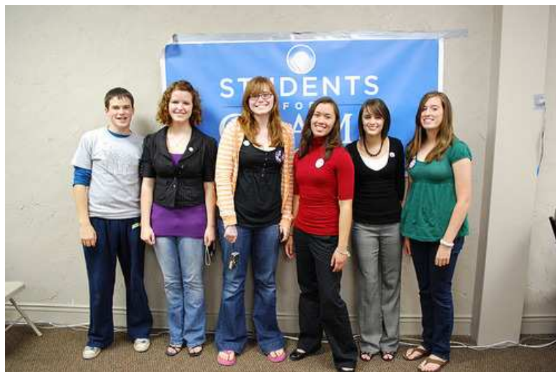
Alcuni studenti durante il Tour in Wisconsin 27

Dal punto di vista del contenuto si può notare che egli è protagonista degli scatti solo in minima parte e che piuttosto il soggetto privilegiato siano i volontari, i nuclei di supporto locale, i politici che l'hanno sostenuto ma anche tutte le persone che ha incontrato nei suoi numerosi viaggi.